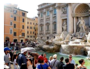
Fontaine de Trevi, Rome!